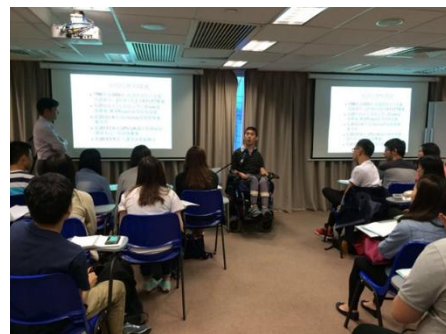
邀請復康科技使用者主講的分享會