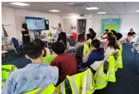
參觀及認識當地社區復康機構的服務特色