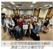
c. 一位使用特殊電腦操控及輔助 溝通工具的全職使用者