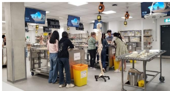
參觀協辦大學的解剖實驗室