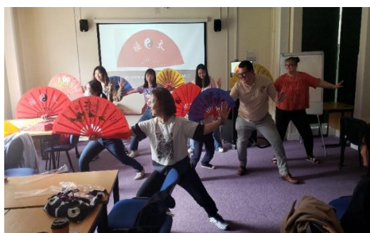
文化交流活動(示範太極扇舞)