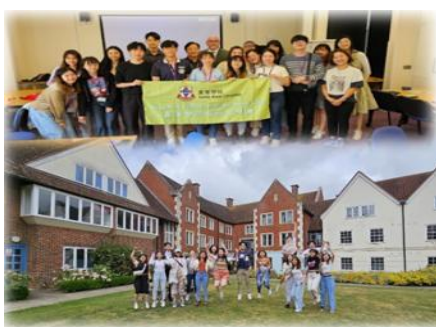
英國學術及文化交流團

為加強學生與海外大學的學習交流，本學系參與了一項國際職業治療系學生的網上學習交流活動，與來自 日本 、 奧地利 、 瑞典 及 葡萄牙 的大學生以視像形式進行專題研習及個案討論，分享和了解在不同社會環境及設施、文化背景、醫療和福利政策下，職業治療理論的實踐與臨床應用上的異同、創新與發展。除提升學習趣味，促進文化交流之餘，亦可擴闊學生的全球視野。此外，本學系每年都與外地大學合辦海外學術及文化交流團，由教師帶領職業治療系學生前往海外大學參與學術研討、學生交流活動和文化體驗，並參觀當地醫院，社福機構或院舍。除因疫情期間停辦外，本學系已舉辦過前往 瑞典 、 澳洲 、 台灣 與 英國 等地的師生交流團，與當地協辦大學、社福及醫療服務機構建立聯系，開拓學術、專業與科研等方面的協作。疫情期間，本學院職業治療系學生亦參與內地的義工服務，學生在導師帶領下，以視像形式為 武漢融樂中心 的殘障兒童提供暑期手功能及書寫訓練計劃和家長培訓。學生可以應用課堂所學的臨床知識及技巧設計及執行適切的訓練活動之餘，亦能透過與兒童、中心職員及家長的聯系和溝通，了解他們在教育及復康訓練方面的情況和需要，以及國內為有特殊學習需要兒童所提供的服務。