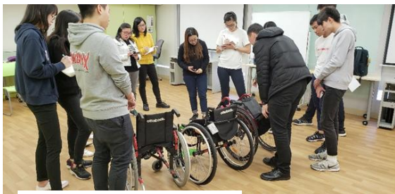
輪椅產品介紹及示範

因應復康科技在職業治療臨床應用方面的需求及發展，本課程亦提供復康輔助科技的相關科目。課堂除教授復康科技的基本概念及臨床知識外，亦著重實用性及技巧實踐，讓學生體驗不同類別的輔助科技、器具或產品，分析及了解其設計特色、適應性及操作需知，並透過參觀、個案示範及討論、專家講座和用家分享，學習如何因應服務對象的功能狀況、活動能力，生活環境及個人或其照顧者的需要，提供適切的評估及選配合適的輔助科技或器具。學生亦需分析、掌握及訓練使用者或照顧者運用輔助器具所需的能力和操作技巧，達到提升使用者的自我照顧能力及獨立性或減輕照顧者的體力負擔、避免長期勞損或意外等目標。為提升學習趣味，並融合臨床實踐與創新意念，該科目其中一項學業評估習作是要求學生以小組研習形式，因應某類殘障或病案的生活自理障礙或照顧上的困難，為其設計及製作一項合適、創新而實用的輔助器具。各小組在課堂分享及展示作品時，其創意特色及操作示範往往獲得其他同學的熱烈回應及鼓勵。部份學生作品亦在「復康工程及輔助科技國際會議(i-CTREATe)」的全球學生創新挑戰比賽中獲邀為參展作品。