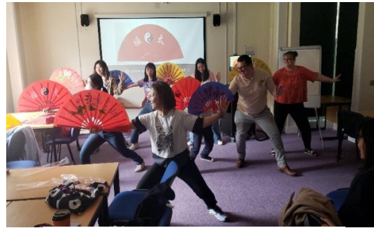
文化交流活动(示范太极扇舞)

职业治疗系学生亦参与内地的义工服务，学生在导师带领下，以视像形式为 武汉融乐中心 的残障儿童提供暑期手功能及书写训练计划和家长培训。学生可以应用课堂所学的临床知识及技巧设计及执行适切的训练活动之余，亦能透过与儿童、中心职员及家长的联系和沟通，了解他们在教育及复康训练方面的情况和需要，以及国内为有特殊学习需要儿童所提供的服务。