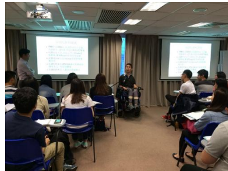
邀请康复科技使用者主讲的分享会