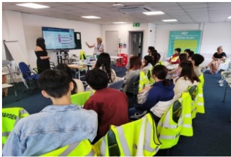
参观及认识当地小区复康机构

职业治疗系学生亦参与内地的义工服务，学生在导师带领下，以视像形式为 武汉融乐中心 的残障儿童提供暑期手功能及书写训练计划和家长培训。学生可以应用课堂所学的临床知识及技巧设计及执行适切的训练活动之余，亦能透过与儿童、中心职员及家长的联系和沟通，了解他们在教育及复康训练方面的情况和需要，以及国内为有特殊学习需要儿童所提供的服务。