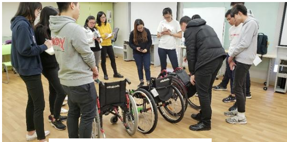
轮椅产品介绍及示范

因应康复科技在职业治疗临床应用方面的需求及发展，本课程亦提供康复辅助科技的相关科目。课堂除教授康复科技的基本概念及临床知识外，亦着重实用性及技巧实践，让学生体验不同类别的辅助科技、器具或产品，分析及了解其设计特色、适应性及操作需知，并透过参观、个案示范及讨论、专家讲座和用家分享，学习如何因应服务对象的功能状况、活动能力，生活环境及个人或照顾者的需要，提供适切的评估及选配合适的辅助科技或器具。学生亦需分析、掌握及训练使用者或照顾者运用辅助器具所需的能力和操作技巧，达到提升使用者的自我照顾能力及独立性或减轻照顾者的体力负担、避免长期劳损或意外等目标。为提升学习趣味，并融合临床实践与创新意念，该科目其中一项学业评估习作是要求学生以小组研习形式，因应某类残障或病案的生活自理障碍或照顾上的困难，为其设计及制作一项合适、创新而实用的辅助器具。各小组在课堂分享及展示作品时，其创意特色及操作示范往往获得其他同学的热切响应及鼓励。部份学生作品亦在「 康复工程及辅助科技国际会议(i-CTREATe) 」的全球学生创新挑战比赛中获邀为参展作品。