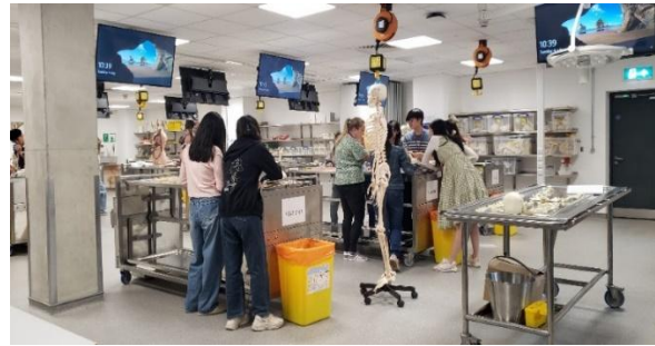
参观协办大学的解剖实验室