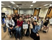
c. 一位使用特殊電腦操控及輔助 溝通工具的全職使用者