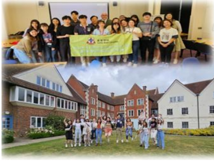
英国学术及文化交流团