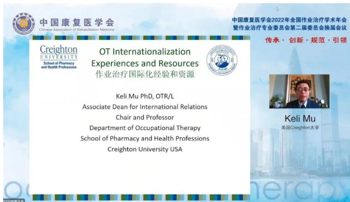
作業治療教育國際化經驗與資源