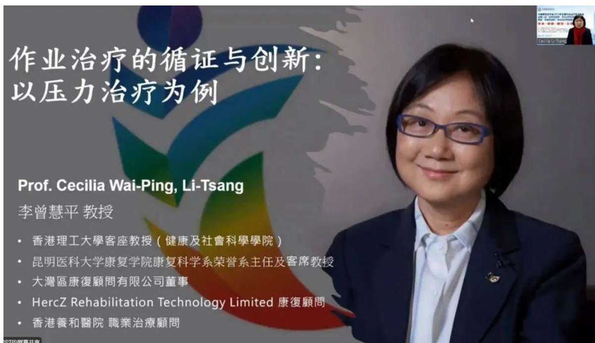
作業的治療循證與創新：以壓力治療為例