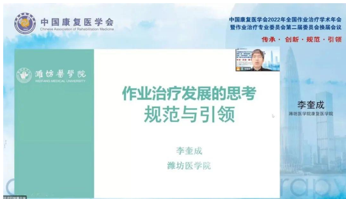
作業治療發展的思考：規範與引領