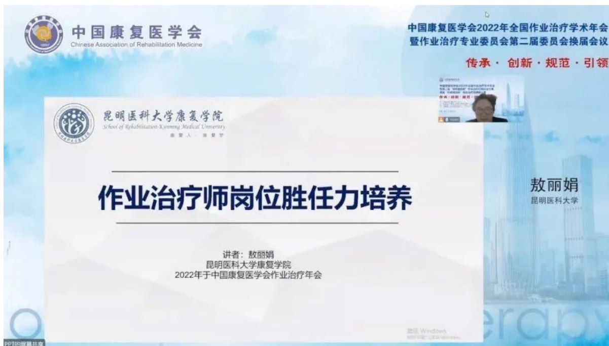
作業治療師崗位勝任力的培養