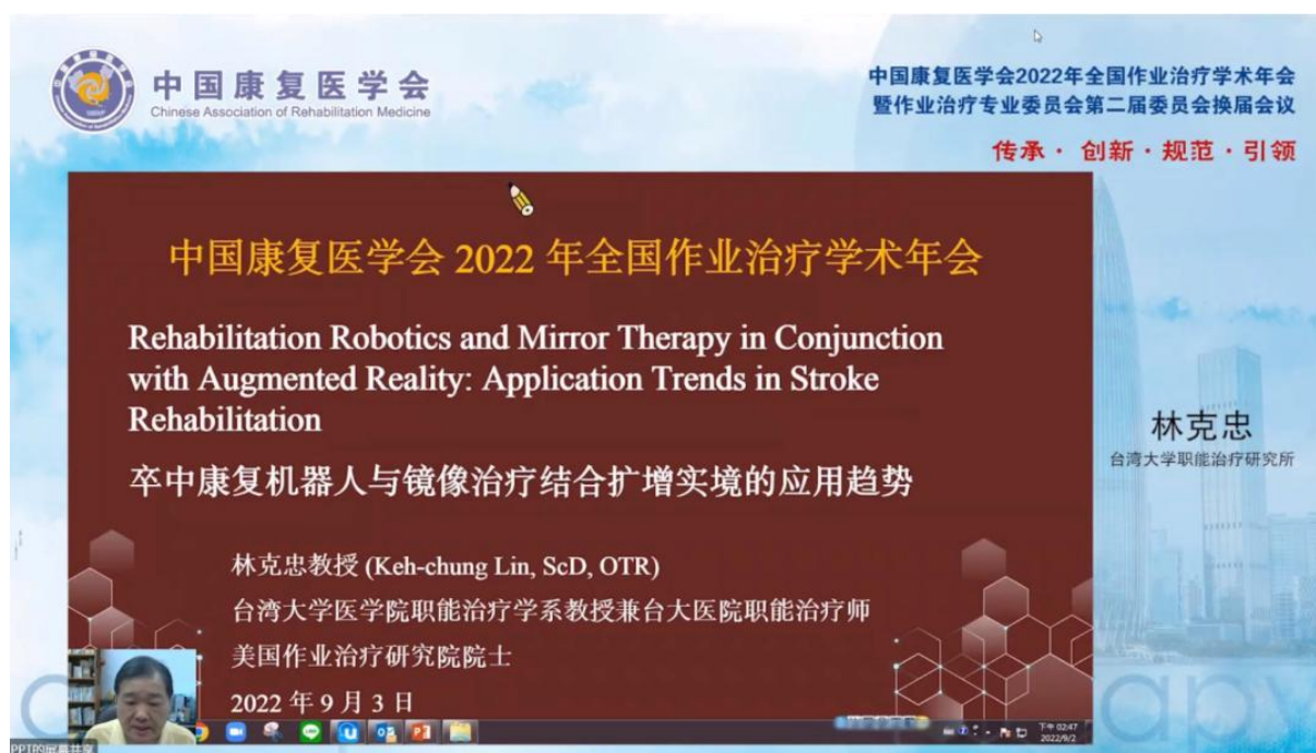
卒中康復機器人與鏡像治療結合擴增實境的應用趨勢