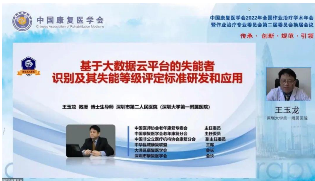
基於大資料雲平臺的失能者識別及其失能等級評定標準研發和應用