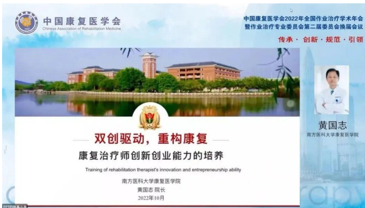
康復治療師創新創業能力的培養