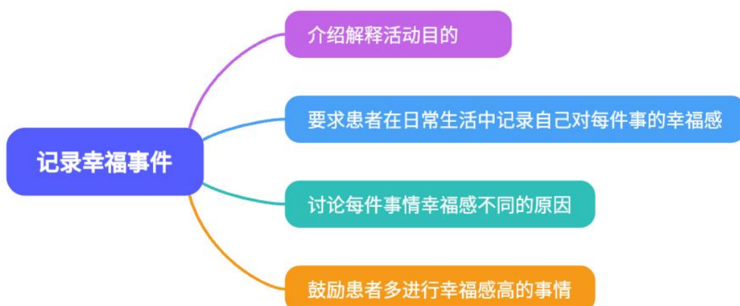
圖 2 傷殘適應技術的活動舉例

適應是使患者自身適應新的或者變化的環境 [7] 。根據患者的情況，可採取兩種應對的策略：同化應對，根據個人偏好積極調整發展和生活環境；調節應對，根據環境、情景調整個人的偏好和目標 [8, 9] 。此外，基於 Ryff 的心理幸福認知模型 [10] 發展出幸福療法（Well-Being Therapy, WBT），幫助患者更加關注積極因素 [11, 12] 。圖 2 為在臨床實踐中設計的活動舉例。我們為患者準備一個筆記本/手帳本/手帳記錄 APP 等，告訴患者使用目的和使用方法，並要求患者每天記錄。記錄的內容可以是任何事情，並給這些事情打幸福感分值，並說明為什麼覺得幸福。定期與患者討論總結，引導患者多多關注幸福感分值高的事情。