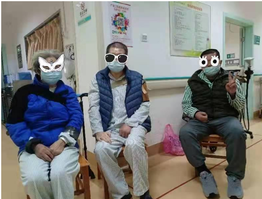
9. 其實還沒結束，其他病友都回去休息了，這三位話癆坐下來又繼續聊了，這張照片我不會告訴你是打斷了很多次（真的很多次）他們談話讓他們先停下來看看鏡頭才拍出來的