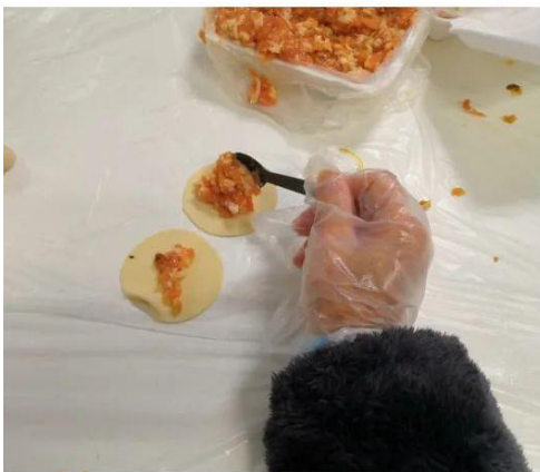
此时的戴叔叔内心：不要拦我！我就再加“亿”点点！