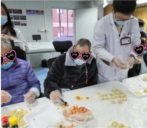
再怎么看这个组合也是如此的赏心悦目啊，但是总觉得哪里怪怪的是咋回事呢~

团圆，是中国人最温暖的仪式，而冬至与家人相聚围餐，也会使人顿感身心安定。此时举办“迎冬至，包饺子”团体活动，旨在利用“家的味道”唤醒患者对于生活的期待、未来的向往。在包饺子的整个过程，对于患者的注意力、执行能力和肢体功能均有促进作用。