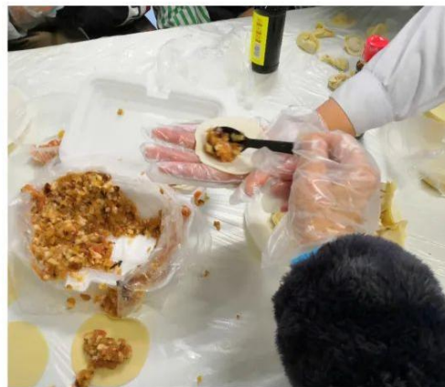
看准时机的小雷治疗师伸出了让戴叔叔帮忙加馅的手，果然收获了满满的肉馅，心满意足的走了。