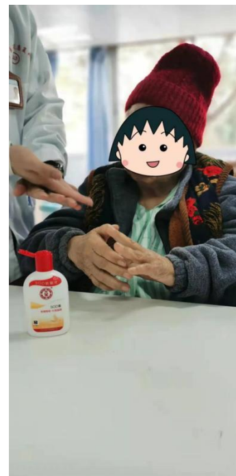
本次活动根据参与患者提供了不同类型的护手霜，治疗师根据参与者的实际情况进行有效引导，并鼓励其独立完成该项活动。