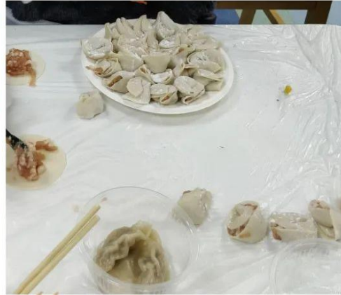
啊！找到了！这快要溢出屏幕的饺子馅是真实存在的吗？此情此景，谁看了不说一声“戴叔叔大气！”呢？