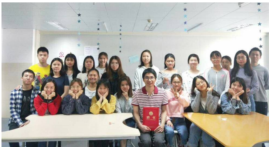
圖 2 香港理工大學來我校授課