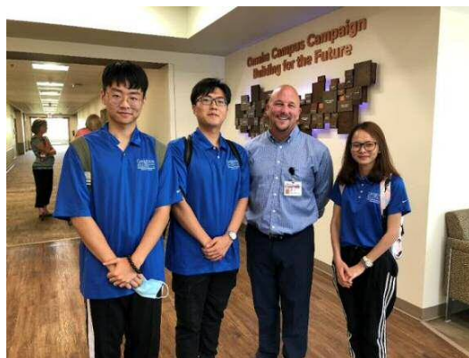
圖 4 美國克瑞頓大學短期見習項目