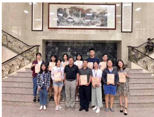
圖 3 臺灣中山醫學大學短期交流項目

臨床實踐注重循證實踐應用，由 WFOT 認證專業教師帶教，要求學生以整體和動態的視角，以理論和研究成果為指導，將專業知識應用於以人為本的環境中，提供無偏見、安全公平的實踐服務，並作為評分依據。實習內容涵蓋各類疾病與人群，參與有關職業、社區、社會、健康、人權、福祉相關的事務，如“三下乡”志願活動，使其對人民健康和福祉做出貢獻。