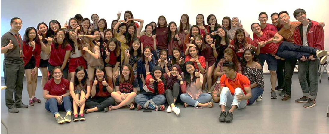
新加坡理工大學第一屆畢業生的照片