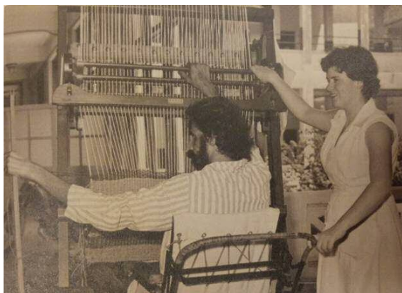
職能治療師使用治療性活動促進病人的肩膀關節活動度，新加坡中央醫院，1959年

職能治療服務在新加坡已有近 70 年之久。職能治療專業本身經歷了巨大的變革，從一開始被認為是編織竹籃的專家，到現在成為一項被普遍認可的專業，服務個案的年齡層和不同的病患，專精提供全人性化的服務以支援個案參與有意義性的職能活動。