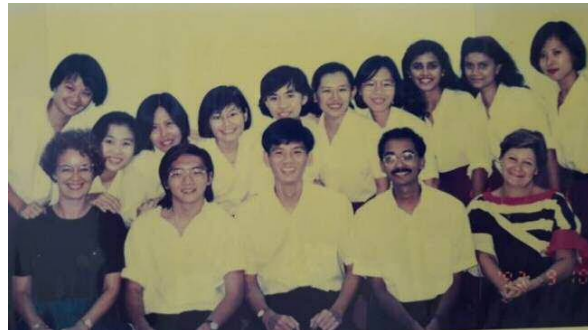
第一届南洋理工学院职能治疗师学程的毕业生和讲师

新加坡第一个职能治疗师学程于 1992 年在南洋理工学院(Nanyang Polytechnic, NYP) 成立。一开始这个课程是根据悉尼大学的课程改编。这个学程顺利地并且持续地获得世界职能治疗师联盟的认证。这个学程从 1992 年到 2018 年间培训了 25 届的毕业生。