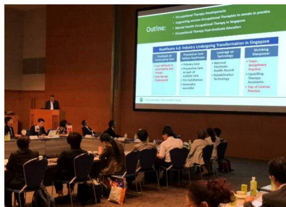
林副教授在 2019 年东亚会议上发表简报

新加坡职能治疗师协会持续在国际和新加坡国内代表职能治疗专业，譬如世界职能治疗师联盟，亚太职能治疗区域小组和东亚会议 (East Asian Exchange Meeting)。