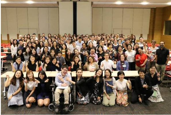
讲者与参与者在 2019 新加坡职能治疗会议的合影

除了代表职能治疗专业以外，协会也举办一系列的活动和会议，以支持专业的发展，例如在多种职能治疗次领域组成特殊兴趣小组，并定期分享各种职能治疗主题，以及多种继续教育的专业训练。除此之外协会定期举办新加坡职能治疗会议。2019 年在国际疫情爆发之前的几个月，我们举办了第十届新加坡职能治疗会议。