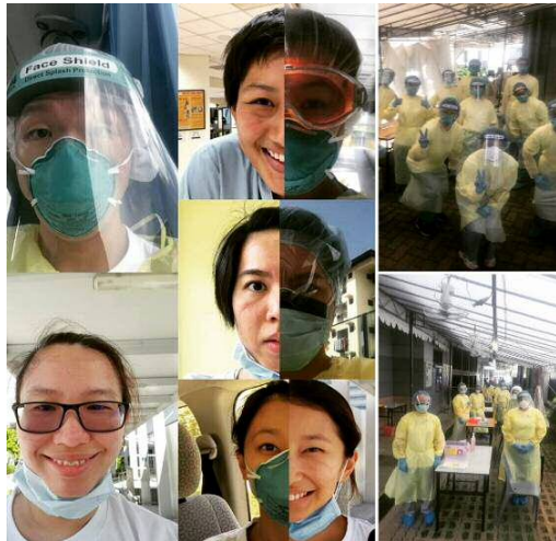
职能治疗师在新加坡各地的筛检站协助筛检工作

对国家以及职能治疗专业而言，新冠肺炎创造了前所未有的挑战。不過值得庆幸也非常激励人心的是，过去一年半之间，我们看到职能治疗师的创造力、毅力和职能治疗师跨领域整合。