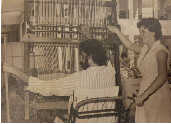
职能治疗师使用治疗性活动促进病人的肩膀关节活动度，新加坡中央医院，1959年

职能治疗服务在新加坡已有近 70 年之久。职能治疗专业本身经历了巨大的变革，从一开始被认为是编织竹篮的专家，到现在成为一项被普遍认可的专业，服务个案的年龄层和不同的病患，专精提供全人性化的服务以支持个案参与有意义的职能活动。