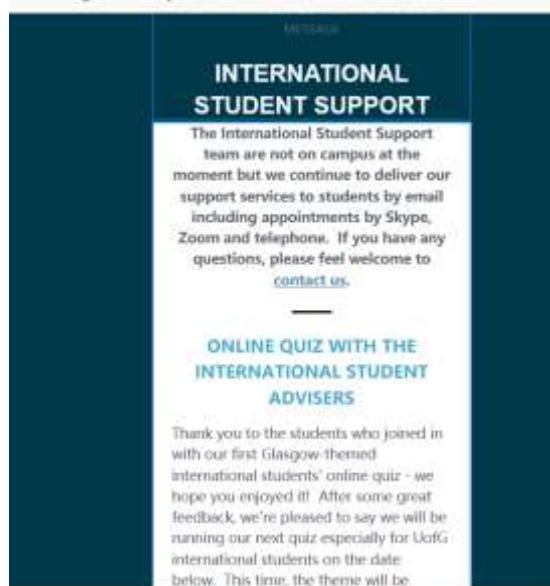
學校的一些支持計畫