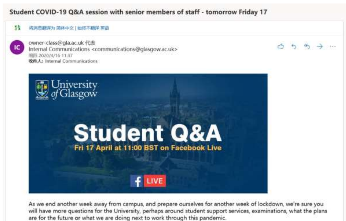
學校關於疫情情況的線上答疑