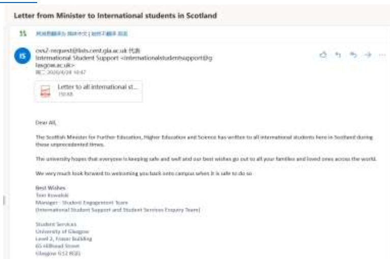
校長寫給國際學生的信件