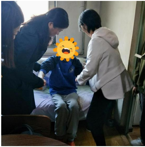
指導患者轉移方式及家居安全