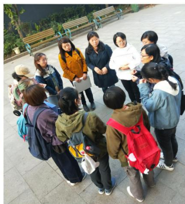
案例結束後小組討論