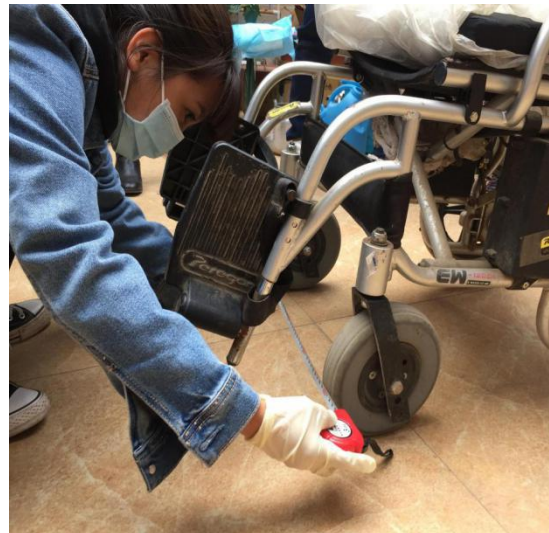
輪椅測量，選擇輪椅