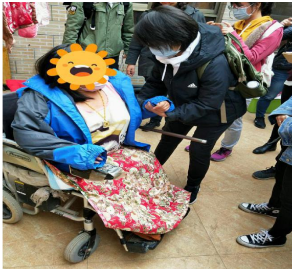
家中測評肌力，教予減壓技術