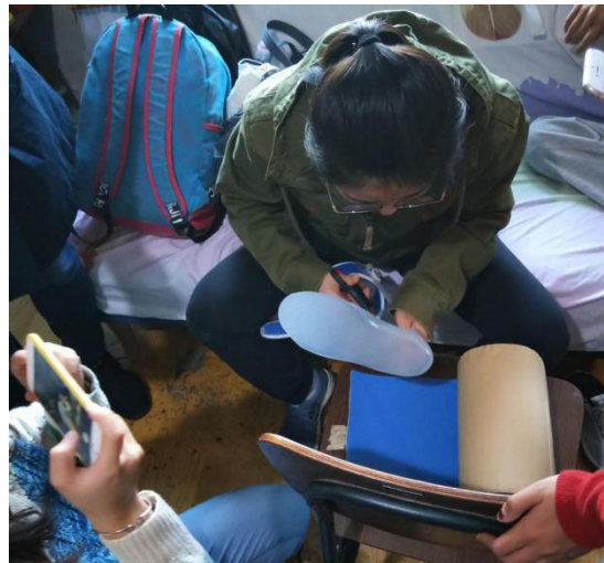
家中現場改良矯正