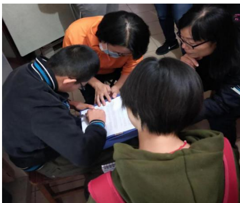
患者家內訪談及評估

本次社區康復行經過了一個多月的精心策劃，共探訪並幫助了三個案例，從脊髓損傷長達二十年的女生到剛剛發病不久康復願望極其強烈的男孩，他們存在著各式各樣的功能與能力障礙，各種原因造成他們不能到醫院去做系統的康復訓練，所以如何讓患者在家中、在社區還能繼續康復訓練，達到最佳的生活品質，是本次 OT 社區行需要思考和解決的重點。