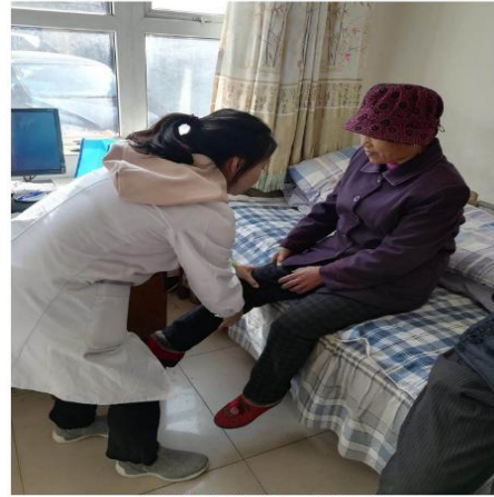
(朱琳老師在為患者進行康復評估及指導)