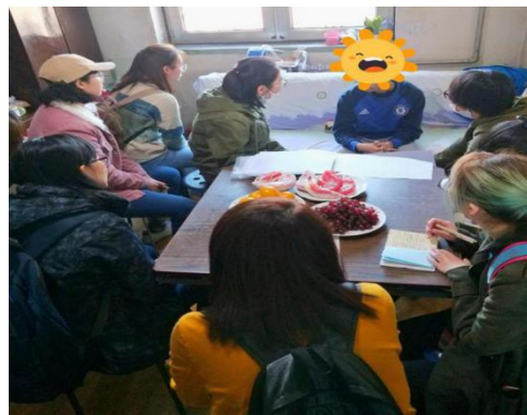
設計改良筆並進行書寫指導