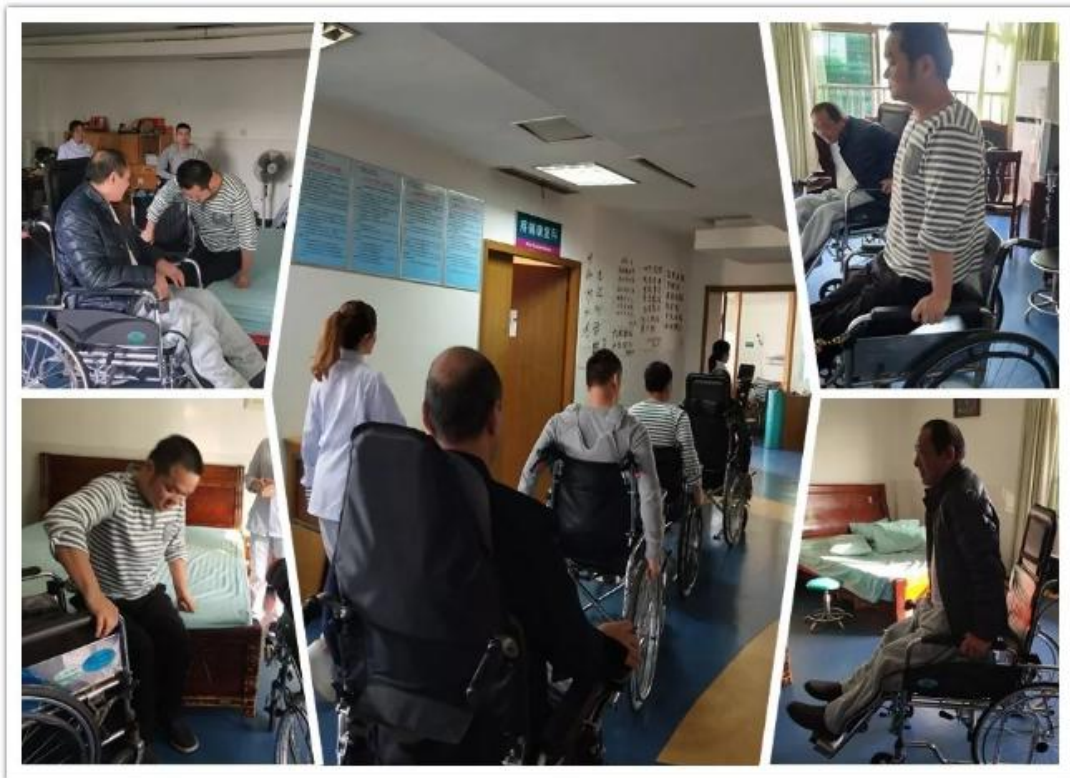
轮椅系列操作演示：轮椅—床转移 轮椅上的减压 普通轮椅的驱动

通过对患者及家属的面谈，我们进一步了解患者需求。患者及家属目前还是希望能找到合适的陪护后到医院进行系统的康复治疗。家属对于患者护理技巧及相关疾病管理知识的需求迫切，这也是我们需要给予帮助的。