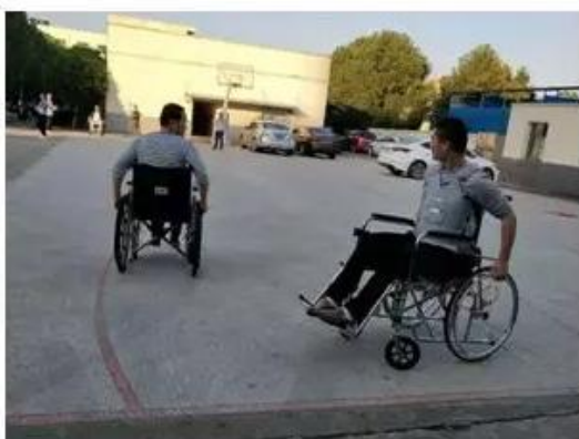
飞奔的轮椅：熟练的轮椅操作，驱动，转弯，调头