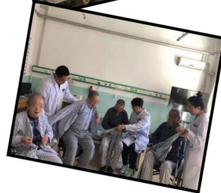
治疗-协助暖人心，患者-家属笑颜!