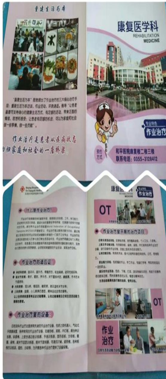
印发了作业治疗的宣传手册