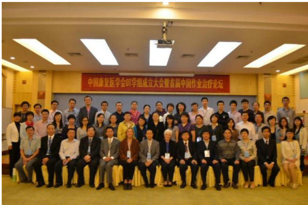
2012 年 6 月 20 日-22 日於海口舉行第二次作業治療學術會議