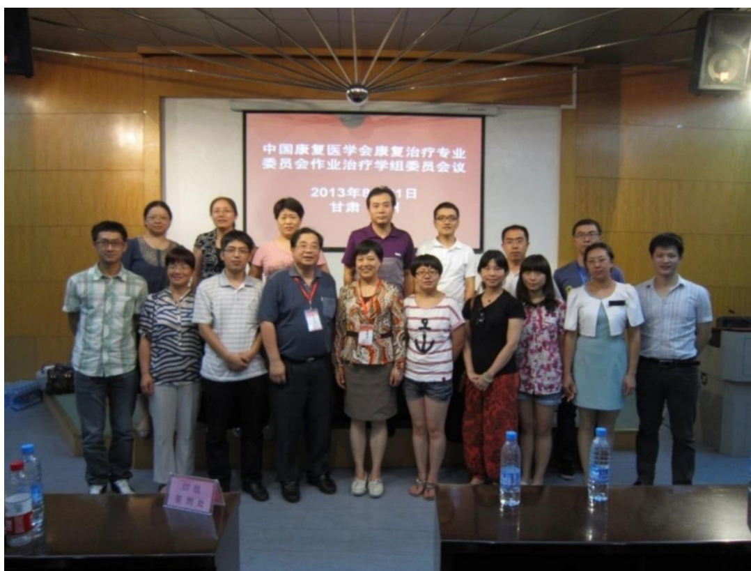
2013 年 8 月 21 日-23 日於甘肅蘭州舉行第三次作業治療學術會議