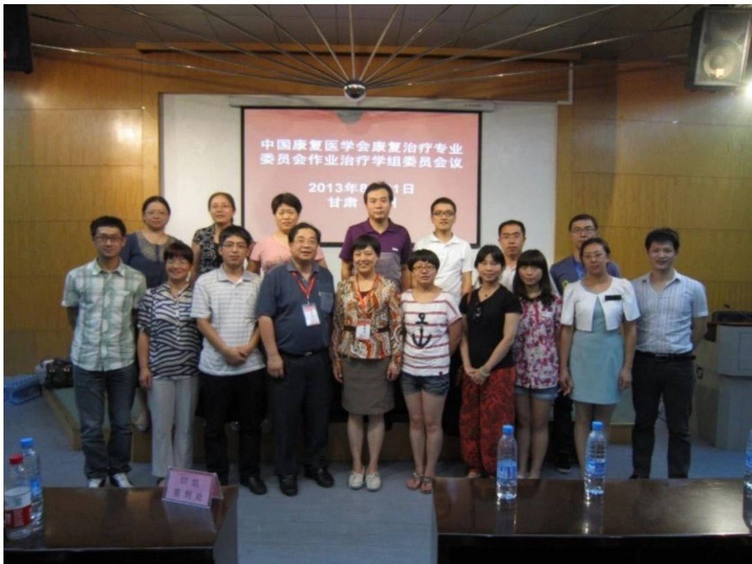
2013 年 8 月 21 日-23 日于甘肃兰州举行第三次作业治疗学术会议