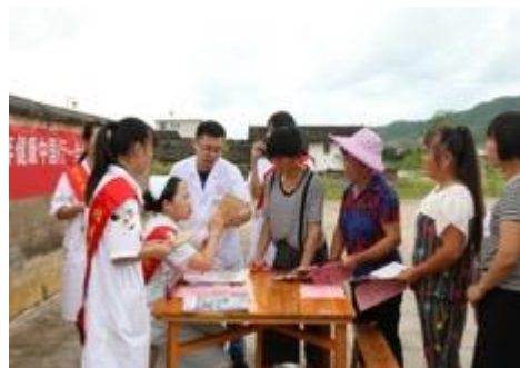
聯合省康復醫院在丰濟村派發藥品