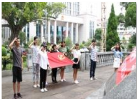
在上杭革命烈士紀念碑前宣誓