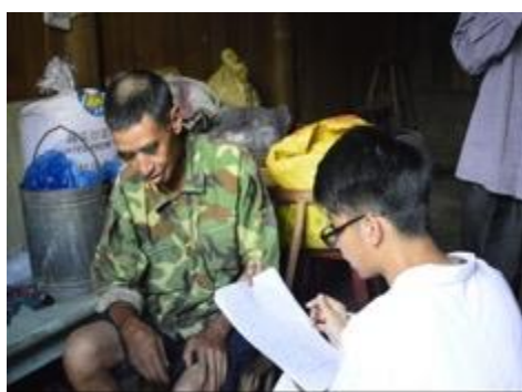
入戶調研村民中風康復情況