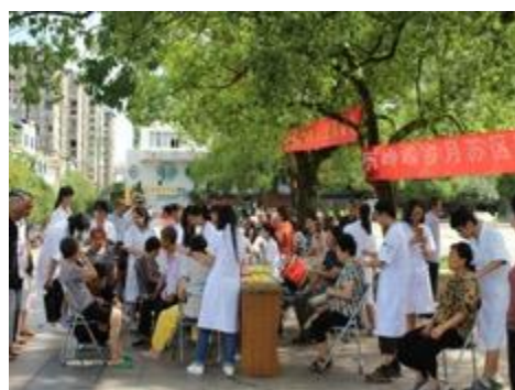
在革命老区举办爱心义诊活动

一份耕耘，一份收穫。在全體成員的努力下，福建中醫藥大學康復醫學院作業治療教研室逐步形成了團結、奉獻、有活力有激情的教研風格，不怕困難、勇於面對挑戰的教研特色。“康復康復，永不止步”。我們堅信：只有求實創新，積極鑽研，才能為全國的康復事業輸送最優秀出色的人才，才會為迎來“健康中國”更加燦爛的明天！