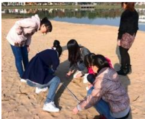
步態參數測量實訓

蓋課程考核、實習前理論考、畢業操作考等，合理、有效、科學地評價並指導學生進行技能培養和完善，使之能夠在最短時間內迅速達到專業技術人才的基本要求，為進入到臨床一線的工作崗位做好充分準備。