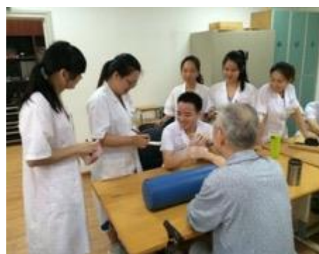
学生在福建省康复医学院作业治部见习