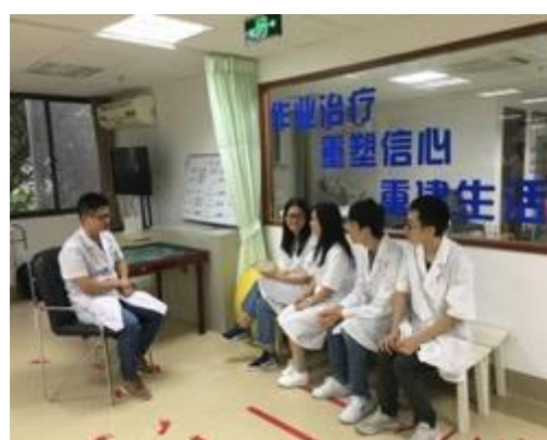
学生跟作业治疗师进行学习交流