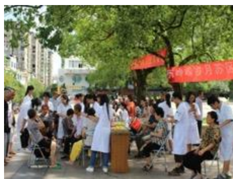
在革命老区举办爱心义诊活动

一份耕耘，一份收获。在全体成员的努力下，福建中医药大学康复医学院作业治疗教研室逐步形成了团结、奉献、有活力有激情的教研风格，不怕困难、勇于面对挑战的教研特色。“康复康复，永不止步”。我们坚信：只有求实创新，积极钻研，才能为全国的康复事业输送最优秀出色的人才，才会为迎来“健康中国”更加灿烂的明天！