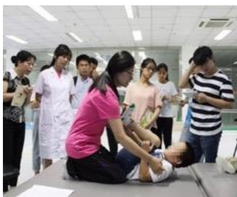
学生在学校附属医院康复科