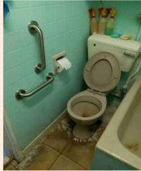
安裝安全扶手及建議清潔用品安全放好

居家作業治療能提升長者的自理、生活、活動能力，但對有健康危機的長者來說，說服他們及讓他們明白當中的意義是較有挑戰性，需要作業治療師的詳細分析及說教才可成事。隨著人口不斷老化，作業治療的介入讓長者活得更有價值，成為社區中的重要一員，各作業治療師應努力推廣，並與醫療機構的人員作緊密溝通，使整個過程更全面及以長者為本。