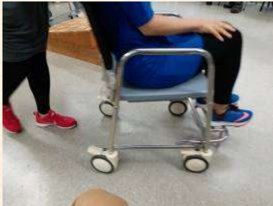
教授輔助工具的使用

助配置及教育、環境改造、照顧者教育等等。其中環境改造是一個較大的版塊，根據 PEO 模式，良好的環境有利長者；惡劣的環境對長者有害。香港職業治療學會出版了一本環境改造的指引，可供參考，作業治療師亦會根據實際情況為長者作改善建議。