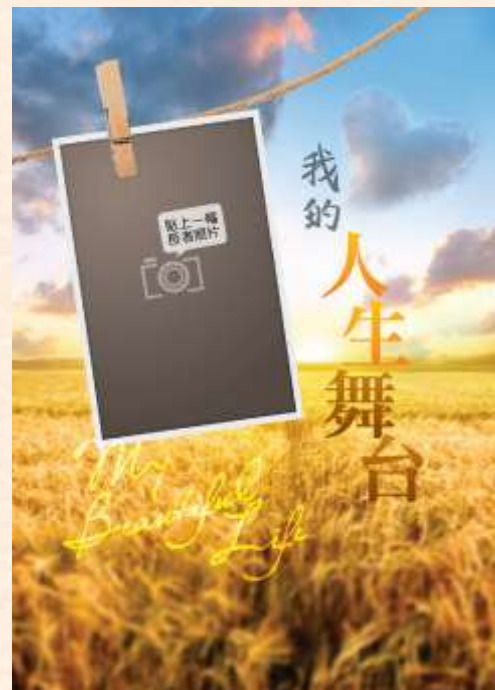
治療師指導家人與認知障礙症患者一同製作屬於長者獨一無二的照片故事集。

即使在長者的家中亦可以個別面談或家庭聚會形式進行懷緬活動。在職業治療師適當的指導下，家屬也可把懷緬活動應用於生活及日常交談之中，藉此把長者與現實生活連結起來。例如逛街時路過「天星碼頭」，便可以談論以往有關的回憶或歷史，從而打開話題。又例如在中菜飯店吃豬腳薑時，可利用視覺、味覺和嗅覺來引發長者分享自己的家鄉小吃或兒時生活。此外，職業治療師亦可以把懷緬活動個人化及恒常化，來幫助家屬更容易地掌握活動內容。例