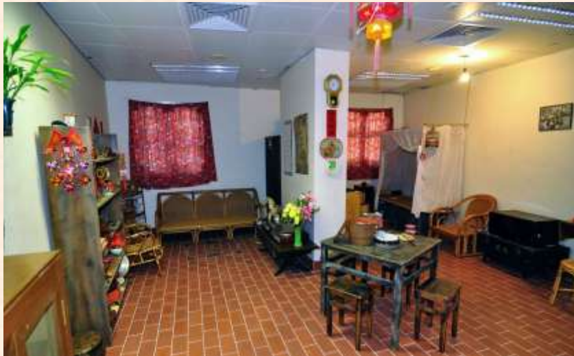
把房間佈置成較生活化的環境能更容易引發長者的記憶（位於青山醫院職業治療部的「懷舊閣」）

交活動的一種，能避免了強迫長者參加治療。利用懷緬小組亦能鼓勵參與者一起回顧生命的歷程，並透過組員之間的互動，讓參與者以不同的角度來面對往事，從中肯定自己過去的付出和貢獻。部分機構更會設立「懷舊閣」，目的是借助環境的佈置去營造一個易於懷緬的氣氛，讓參與者可以更立體地投入懷緬主題。