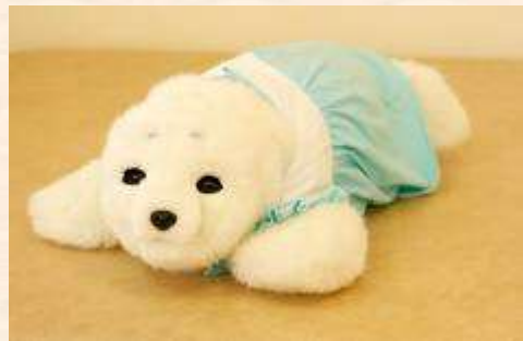
圖一：寵物機械海豹 PARO

機械人輔助治療能有效減少認知障礙患者的行為和心理症狀 (BPSD)，改善情緒，並促進患者的社交互動和交流 (Bemelmans R. 等, 2012)。如圖 1 所示，寵物機械海豹 PARO 在過去十年已經在各個國家應用，並取得積極成效。然而，目前有關機器人治療於香港的應用有限，其治療效果及相關資料亦甚少刊載。