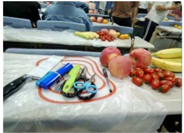
根据病情，准备工具和食材