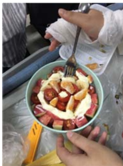
品味成果，重建生活