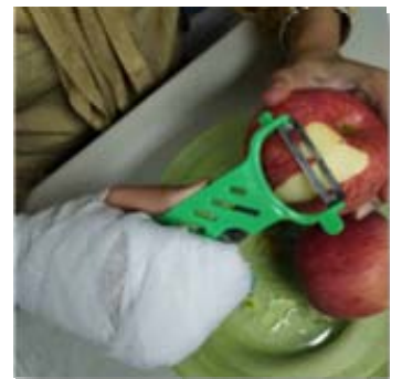
制作过程-尝试解难