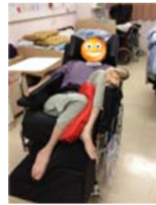
利用訂制的座椅離開睡床，大大提高生活質素