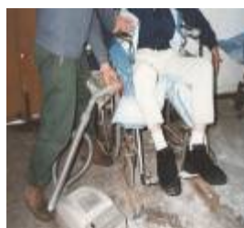
用吸塵機吸塑出坐墊及背墊的形狀