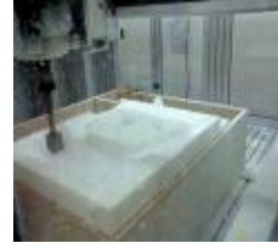
製作出度身訂制的軟墊