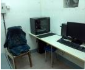
利用掃描器把模型的三維影像轉為數碼，傳輸至計算機