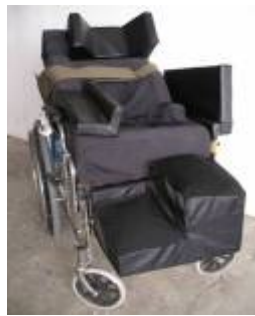
度身訂制塑型復康座椅