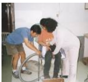
在協助下，坐在自製的豆袋上