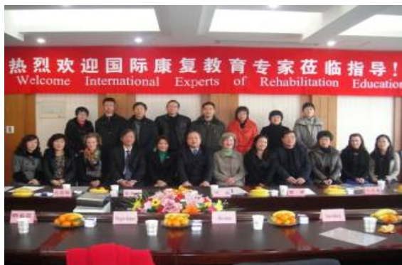
2012 年 12 月中-挪合作分专业试点教学中期评估

我校 OT 专业的建设在学校和医学院的支持下，在全体教师的努力下，正在按照 WFOT 的《作业治疗师培养教育最低标准》的要求，不断前行。师资力量方面，我们在 3 名 OT 教师参加中外合作 OT 教师培训的基础上，又有 2 名 OT 教师攻读香港理工大学在四川大学举办的 MOT 学习，OT 教师数量达到 5 名，水平也在不断提高。教学实验室在这两年充实的基础上，2015 年将有江苏省重点专业建设的经费支持，实验室将进一步得到改善；同时各实验见习、实习基地通过近两年的磨合和实践，积累了一定的带教经验，能够逐渐适应和达到我们教学大纲的要求。2015 年我们还将落实学校关于引进师资、提高教学水平的“OT 专业提升计划”，邀请国内外有名的 OT 教师、专家来校授课、传经送宝，全面提高我们教师的教学水平、提高 OT 专业的教学质量。争取在 2015-2016 教学年度申报和通过 WFOT 的国际教育论证；我们也将一如既往的虚心向国内外同行学习 OT 专业的办学经验，努力为国家培养合格的作业治疗专业人才。