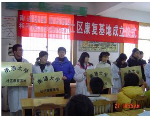
社区康复基地 20 家