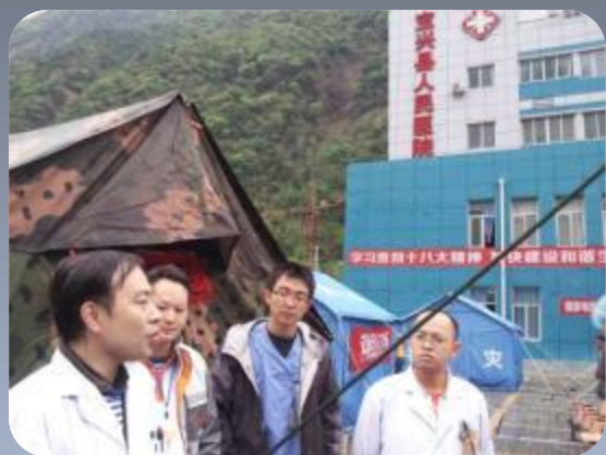
每天晨会，分配任务。医院后面山上余震不断，有落石所有伤员都住在帐篷区内