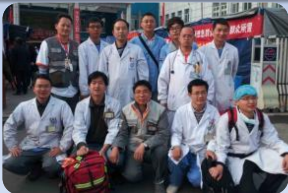
所有空降救灾医疗队成员