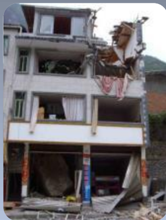
帐篷医院旁边的惨景，大石头从4楼右上角砸到了1楼左下角，每天余震山上的石头都往下落，救治队员外出都要先看山上有无危险