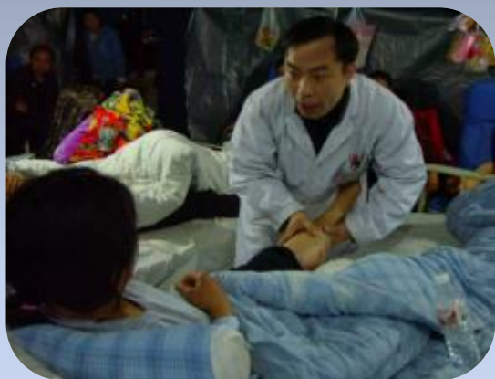
帐篷医院中对伤员进行作业治疗