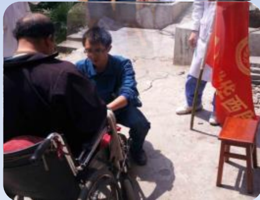
偶遇5.12地震时康复过的伤员