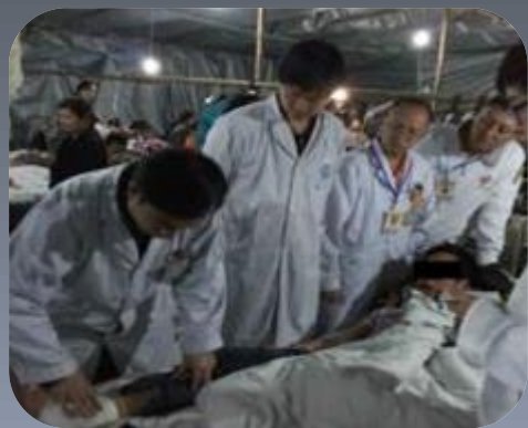
帐篷医院中对伤员进行 康复评估