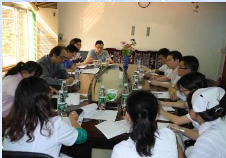
香港职业治疗学院 OT 与虎门医院员工展开工作会议

香港职业治疗学院每月派资深香港 OT 到虎门医院临床指导，全面参与神经康复系统建设，包括确定康复设备、工具、家俱、场地建设；制定临床流程，医疗处方规范，评估规范，治疗规范；建议医疗康复专案、收费标准、人员分工等等；积极参与脑卒中、脑损伤术后康复治疗，提高该院 OT 在神经康复的广度和深度；列席参与日常查房和评价会，制定短期、中期和长期全面治疗方案，促进患者尽早恢复日常独立生活能力。